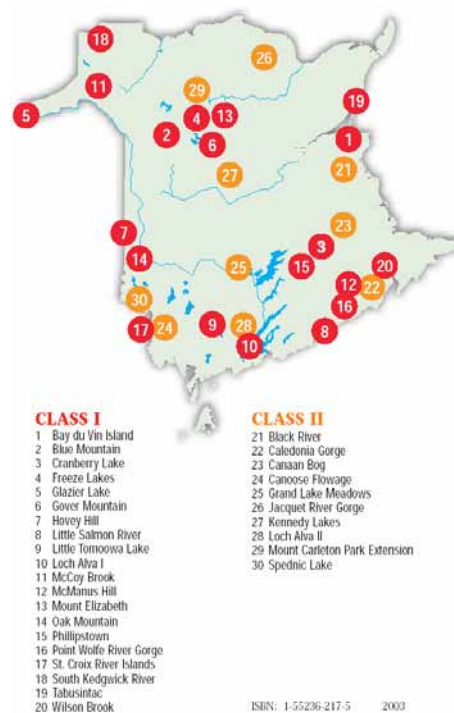
Figure 1 : Zones naturelles protégées du Nouveau-Brunswick