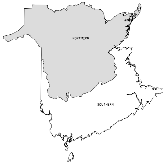
Figure 2. Zones d'aménagement de l'habitat d'hivernage du chevreuil